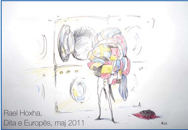
Rael Hoxha, Dita e Europës, maj 2011

integritimit mund të kolapsojë, duke lënë të ardhmen e Europës pezull.”