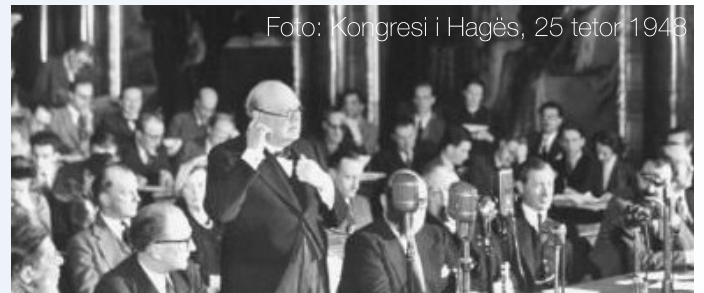
Foto: Kongresi i Hagës, 25 tetor 1948

Më 25 tetor 1948, 63 vjet më parë u themelua Lëvizja Europiane (European Movement International). Presidenti i parë u caktua Duncan Sandy, ndërsa Léon Blum, Winston Churchill, Alcide De Gasperi dhe Henri Spaak u zgjodhën Kryetarë Nderi. Arritja e parë e madhe e Lëvizjes Europiane ishte krijimi i Këshillit të Europës në maj 1949, e më pas Kolegjit të Europës në Bryzh dhe Qendrës Europiane të Kulturës në Gjenevë. Origjina e Lëvizjes Europiane nis që në korrik 1947, në një kohë kur ideja e një Europe të Bashkuar nxitej nga Winston Churchill në formën e Lëvizjes së Bashkuar Europiane anglo-franceze. Në 25 tetor të vitit 1948, Kongresi i Hagës, kryesuar nga Winston Churchill, bëri thirrje për një bashkim politik, ekonomik dhe monetar të Europës. Kjo datë, është dhe lindja zyrtare e Lëvizjes Europiane. Që nga themelimi i saj, Lëvizja Europiane ka qenë e udhëhequr nga figura të shquara europiane publike të tilla si Robert Schuman, Walter Hallstein, Enrique Baron Crespo, Valéry Giscard d'Estaing, Mario Soares, Jose Maria Gil-Robles dhe Pat Cox .